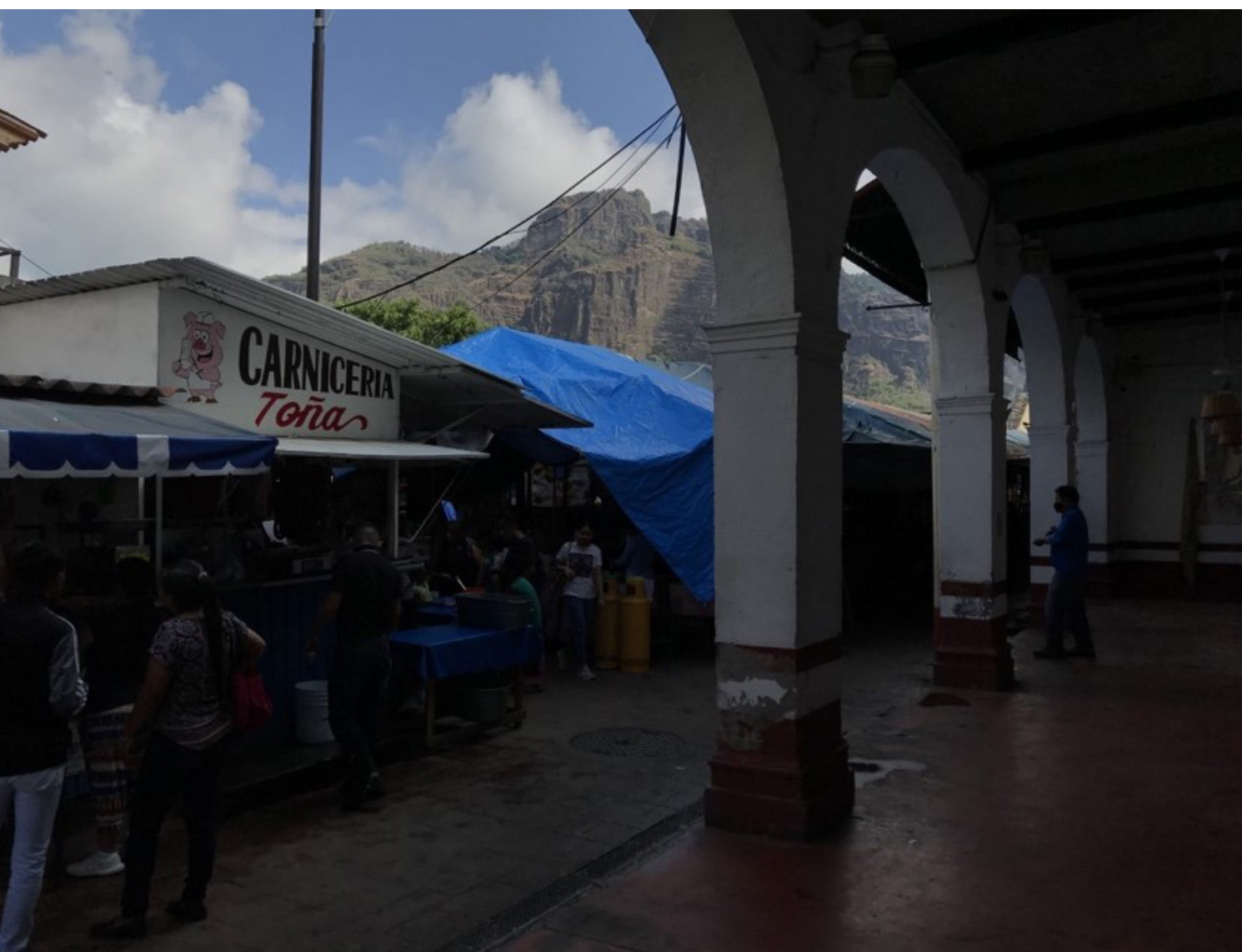
Figura 2. Fotografía de la plaza cívica desde la esquina interior sureste (el portal), Tepoztlán, Morelos. Fotografía por (JMSH), (2020). Consultado en octubre de 2023.