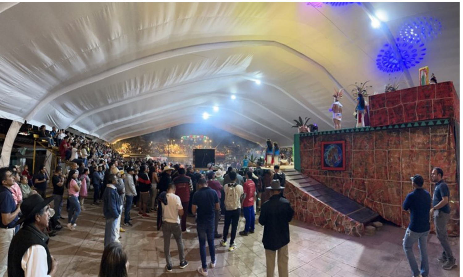
Figura 8. Fotografía de la plaza cívica durante la representación del Reto al Tepozteco vista desde la esquina sureste del mercado, Tepoztlán, Morelos. Fotografía por (JMSH), (08/09/23). Consultado en octubre de 2023.

Es fundamental encontrar un equilibrio entre el turismo como actividad productiva que beneficia la economía de los habitantes de Tepoztlán y la conservación y el respeto a las identidades y la calidad de vida de las personas, lo anterior puede hacerse desde una participación comunitaria, en donde se involucre a los tepoztecos en la toma de decisiones la escucha sensible que permita garantizar que se respeten y se protejan sus intereses.