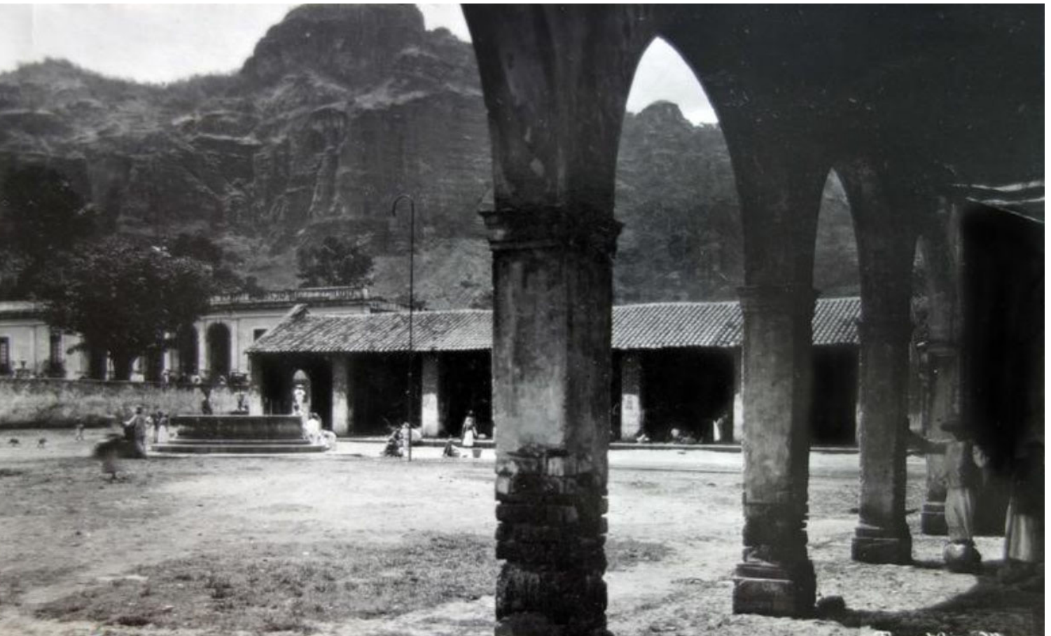
Figura 1. Fotografía de la plaza cívica vista desde la esquina interior sureste (el portal), Tepoztlán, Morelos. Siglo XX. Autor desconocido (ca. 1935). Consultado en octubre de 2023.

Tepoztlán es reconocido en el año 2002 como Pueblo Mágico por su historia, recursos naturales, arquitectura colonial y prehispánica, además de por las tradiciones y costumbres de sus pobladores, se distingue por conservar el empedrado en sus calles, por el paisaje natural del Parque Nacional el Tepozteco que rodea al pueblo, por lo simbólico relacionado con la montaña, por su patrimonio construido como el Ex Convento de la Natividad, el Museo Carlos Pellicer, el Museo y Centro de Documentación Ex Convento de Tepoztlán y por las actividades tradicionales y rituales como el Carnaval, el festejo a los muertos, la celebración del equinoccio que permite admirar la llegada de la primavera desde la pirámide y el reto al Tepozteco.