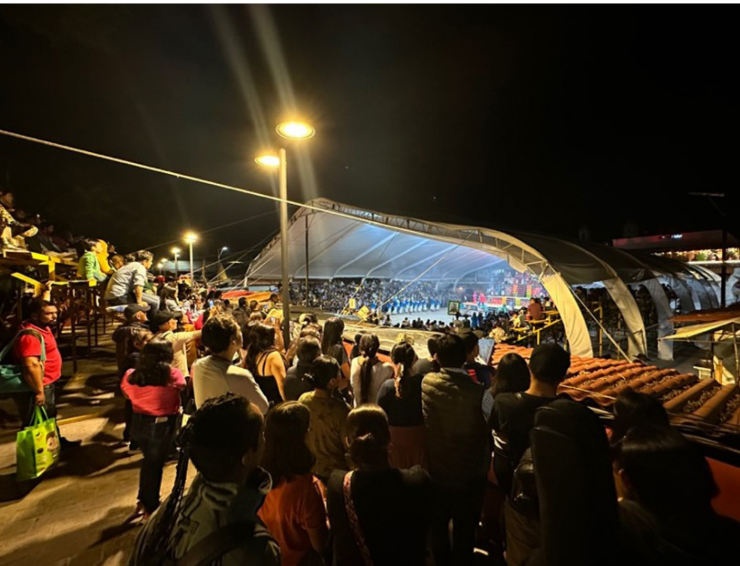
Figura 7. Fotografía de la plaza cívica durante la representación del Reto al Tepozteco vista desde la esquina sureste del zócalo municipal, Tepoztlán, Morelos. Fotografía por José Miguel Sedano Hidalgo, en adelante (JMSH), (08/09/23). Consultado en octubre de 2023.

Es relevante mencionar que a la plaza no solo se asiste para fines de consumo también es un lugar, como se mencionó anteriormente, donde se comparten vivencias en fechas específicas como en la representación del Reto al Tepozteco, celebración basada en una leyenda local, es este momento un detonador de recuerdo y una tradición que construye la identidad de los habitantes, o como en todo el país en la conmemoración del Grito de Independencia la noche del 15 de septiembre, al día siguiente es la plaza el punto final del desfile cívico del municipio. Otro uso importante que sin duda identifica a los tepoztecos es el carnaval que se celebra cada año con fecha móvil entre febrero, marzo y abril y en el que se brinca al compás de los diferentes sones entonados por bandas tradicionales que en conjunto al espacio físico se anclan al imaginario e identidad tepozteca.