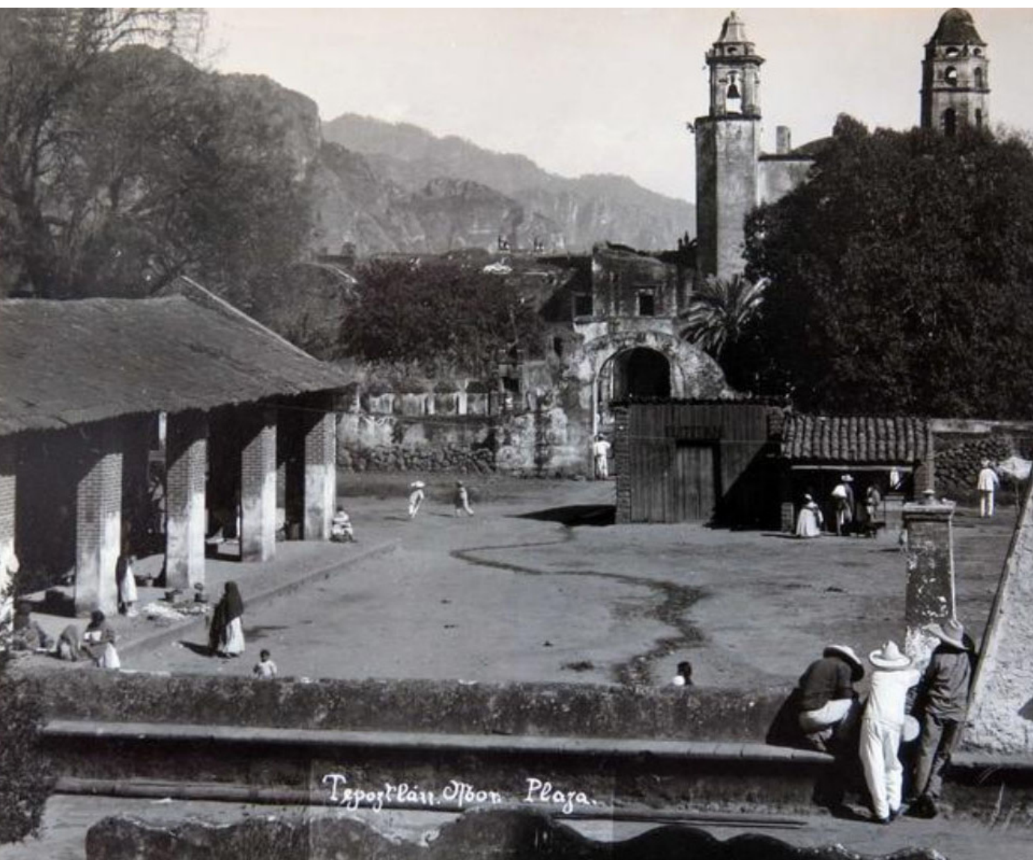
Figura 5. Fotografía de la plaza cívica vista desde el zócalo municipal, Tepoztlán, Morelos. Siglo XX. Autor desconocido (ca. 1935). Consultado en octubre de 2023.

Por ejemplo, algo que se puede observar que está muy presente el día de hoy es la comida exótica que anteriormente no se veía ya que se comenzó a ver hace apenas algunos años. Ahora bajas al mercado y encuentras variedad de platillos como venado o incluso algunas especies de víboras que llegan a vender y ofrecer, incluso conejo. Son este tipo de fonditas o restaurantes dentro del mercado que anteriormente no estaban y ahora justo porque es algo que se ha vendido, algo que se ha hecho popular, no solo por la entrada de turismo nacional si no también turismo extranjero.