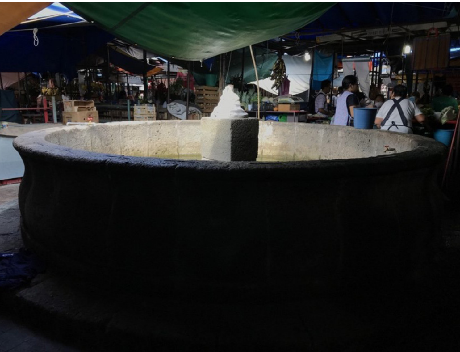
Figura 4. Fotografía de la plaza cívica, en primer plano se presenta la antigua fuente, la visibilidad se encuentra obstaculizada hacia el zócalo municipal, Tepoztlán, Morelos. Fotografía por (JMSH), (2020). Consultado en octubre de 2023.

Al respecto Ildelicia Ortiz de 23 años comenta lo siguiente: