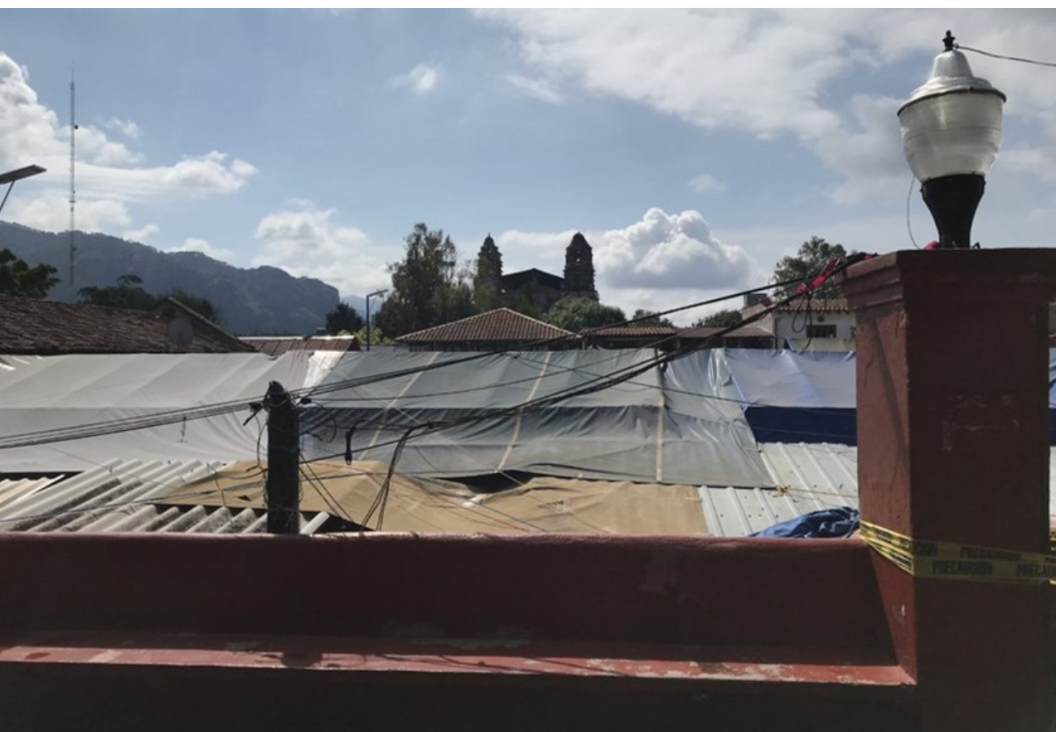
Figura 6. Fotografía de la plaza cívica vista desde el zócalo municipal, presentando una invasión del espacio en su totalidad, Tepoztlán, Morelos. Fotografía por (JMSH), (2020). Consultado en octubre de 2023.

Ildelicia comenta que incluso, a consecuencia de lo anterior, la venta de algunos alimentos que son parte importante de su comida diaria ha disminuido: