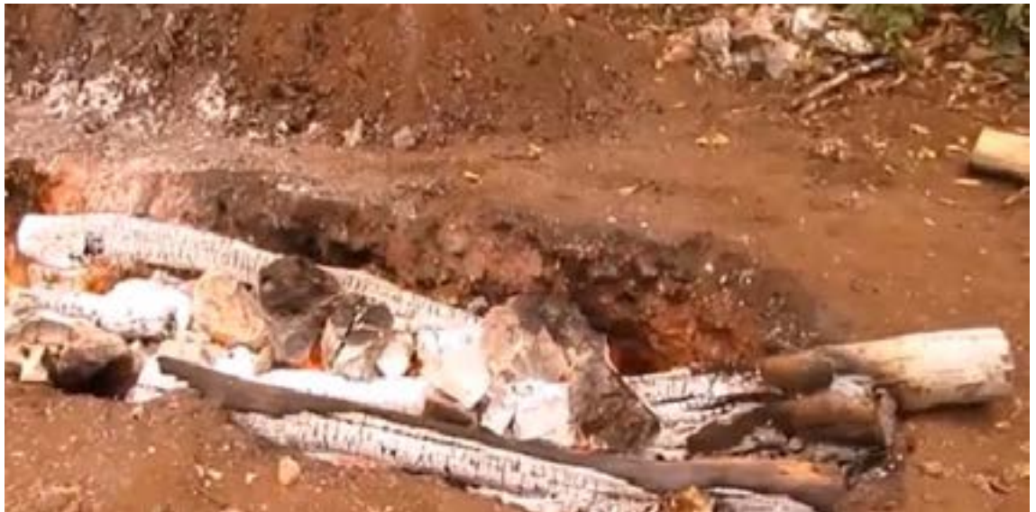
Figura 4. Preparación del pib.

En las fiestas, cada integrante de la familia tiene una tarea asignada, desde el más pequeño hasta los adultos, la cocinera prepara la olla con agua en el fogón mientras que el hombre es quien sacrifica a los pollos, que introducen al agua caliente para que posteriormente los niños los desplumen, y la cocinera los limpia y prepara los insumos para la comida. También los hombres colaboran realizando el hoyo del pib (técnica de cocimiento bajo tierra cocido a las brasas, enterrado) para la cocción de los alimentos (figura 4).