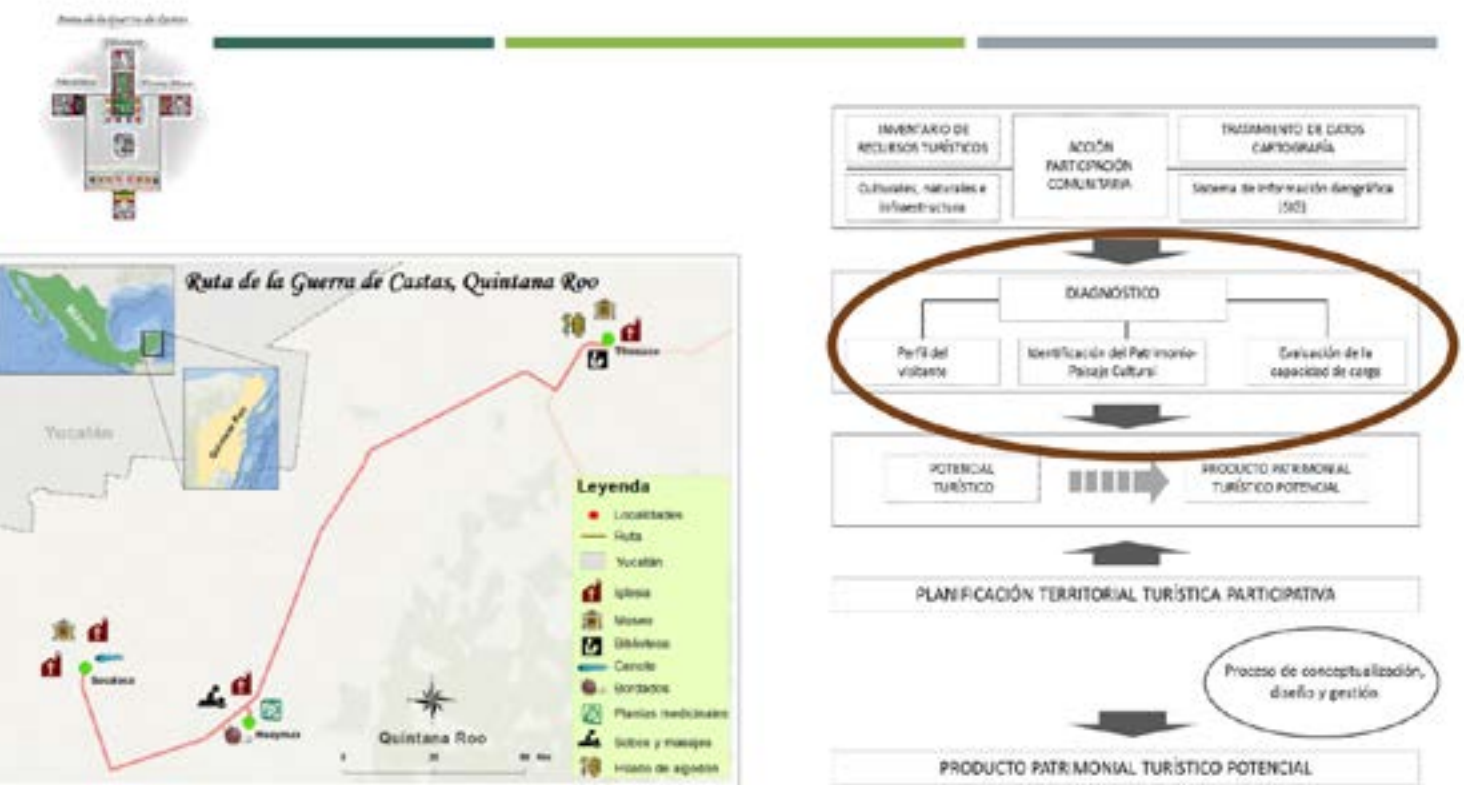
Figura 1. Ubicación de Sacalaca, Quintana Roo que forma parte de la Ruta de la Guerra de Castas (Imagen propia).

Sacalaca se ubica en el municipio de José María Morelos, en el estado de Quintana Roo (figura 1). La comunidad es de origen maya, considerada históricamente como parte de la Ruta de la Guerra de Castas. En Sacalaca, parte de sus recursos naturales y culturales, existen dos iglesias coloniales, disfrutar de la actividad de nado en el cenote Nojoch Ts'ó'ono'ot , realizar rappel, senderismo en su selva, visitar otro cenote llamado Yó Ts'ó'ono'ot , visita a la milpa y apiario tradicional, participar de sus fiestas patronales y disfrutar de su gastronomía con platillos de olores y sabores del campo maya.