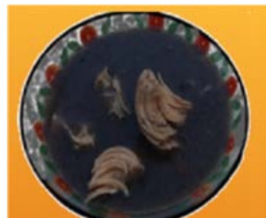
Figura 6. Boox K'ool (relleno negro).