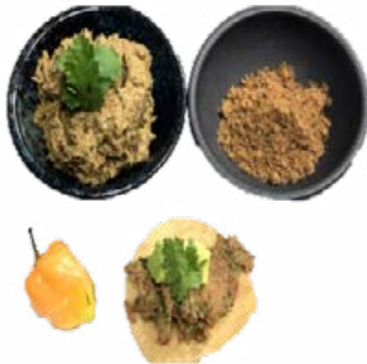
Figura 3. Paapa'suul en Yucatán.y en Quintana Roo, Sikli p'aak en Yucatán.

Un detalle a resaltar es que la comida denominada Paapa'suul (pepita de calabaza molida y revuelta con tomate, chile y cilantro) en las comunidades mayas de Yucatán es conocido como Sikli p'aak , ya que el primero es una pasta también de semilla de calabaza en la que remojan una tortilla y envuelven huevo para formar un taco que cubren de tomate (figura 3). Aunque los ingredientes son similares, la presentación es diferente. Esto permite observar la variabilidad en el nombre de los guisos de regiones cercanas y el consumo de ingredientes en común.