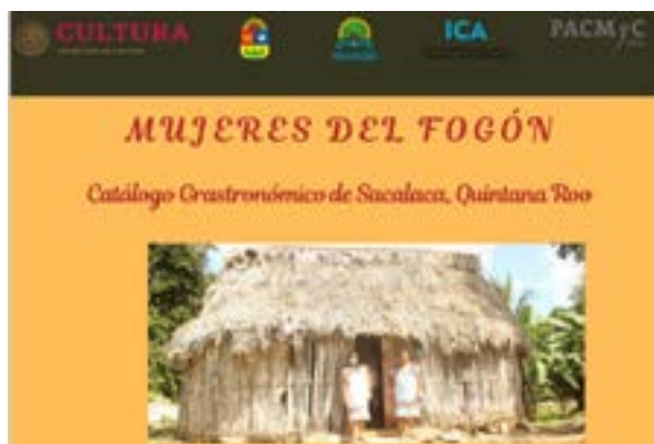
Figura 5. Catálogo Gastronómico de Sacalaca, Quintana Roo.

De las entrevistas, se recuperaron las recetas de las 29 comidas registradas, se detallaron los ingredientes y las técnicas de preparación, así como una leyenda, historia o costumbre asociada, y se plasmó en un catálogo Gastronómico que se dividió en dos partes, comidas cotidianas y comidas rituales (figura 5). Fue posible identificar las creencias e historias relacionadas con la comida, entre las que destacan los guisos que llevan recado (condimento en pasta) hecho de chile, desde una semana o tres días antes de la preparación. Como se mencionó anteriormente, la comida más significativa de la comunidad es el Boox K'ool (relleno negro, figura 6) que se le ofrece a la gente que acude a las celebraciones como los gremios y festejos como cumpleaños, bodas, quince años, entre otros.