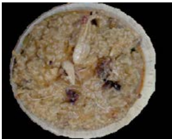
Figura 7. Comida para k'èex.

Esta ceremonia está asociada a la comida, ya que la realiza el Jmen (oficiante maya) o una curandera, y se ofrece comida en el altar que consiste en un gallo si es niña y, si es niño una gallina, esto es, del sexo contrario, que se prepara en un caldo rojo hecho de achiote ( Bixa Orellana ) mismo que se usa en el guiso de cochinita pibil. La comida tiene que ser consumida en su totalidad por quién sea el destinatario de la ceremonia, y los huesos son descartados en el traspatio, enterrándolos, ya que están cargados de la energía desechada (figura 7).