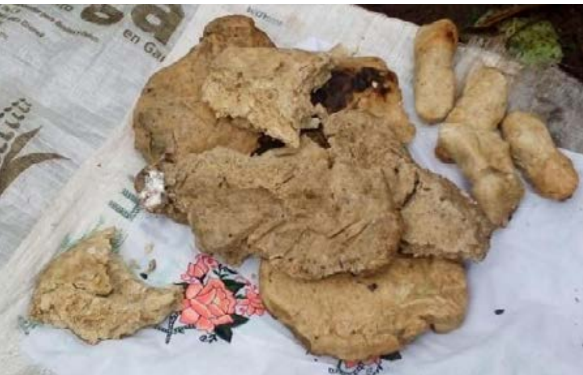
Figura 8a. Comida para Chóokòòb.

Estos son algunos de los conocimientos, creencias y costumbres que se recopilaron a través de esta investigación. El pensamiento maya se refleja en la gastronomía; la filosofía maya en las comidas expresa la vida social cultural de los pueblos y los representa ante otros grupos sociales, el cual es la vida misma que se construye día a día.