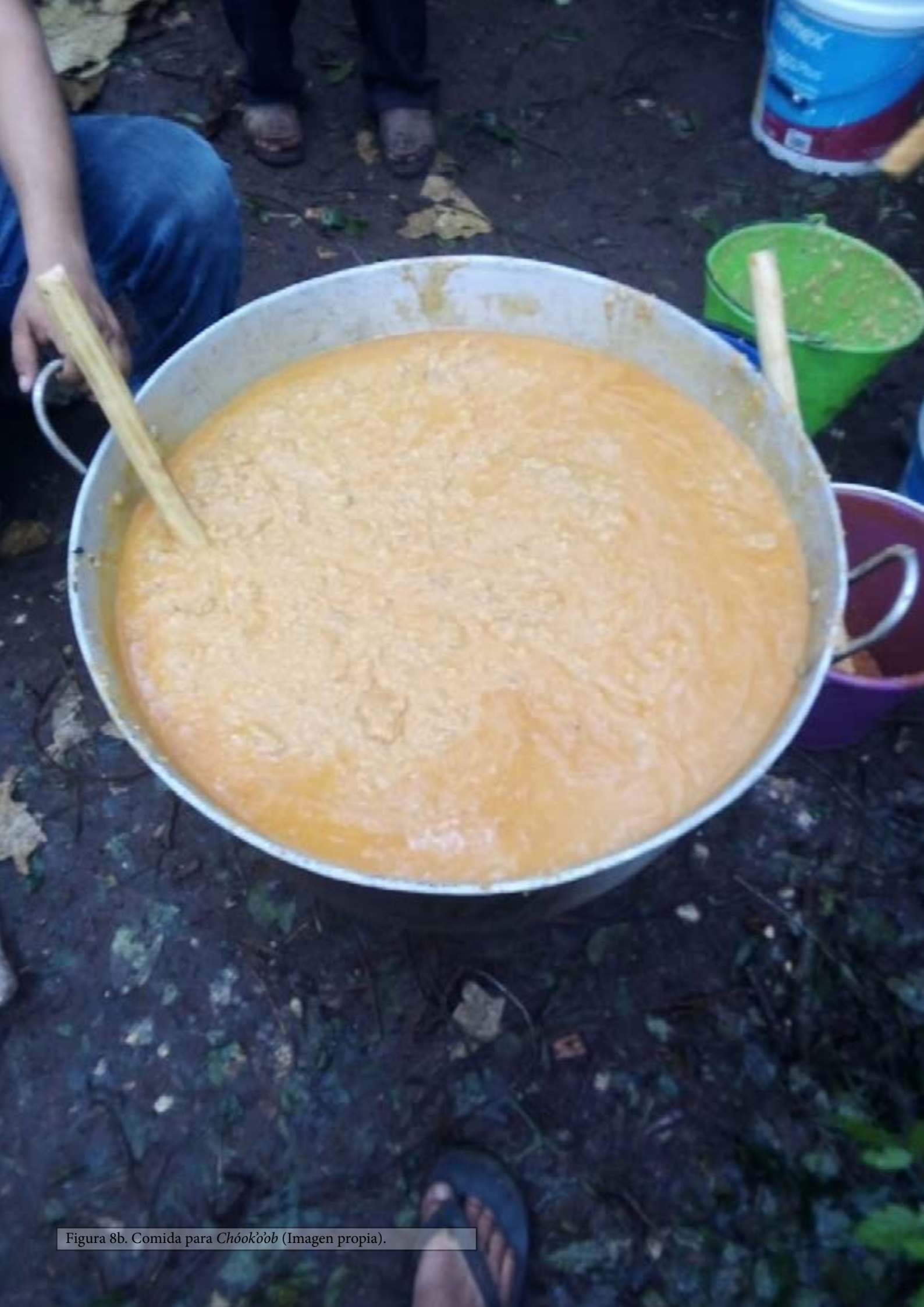
Figura 8b. Comida para Chókò'òb (Imagen propia).