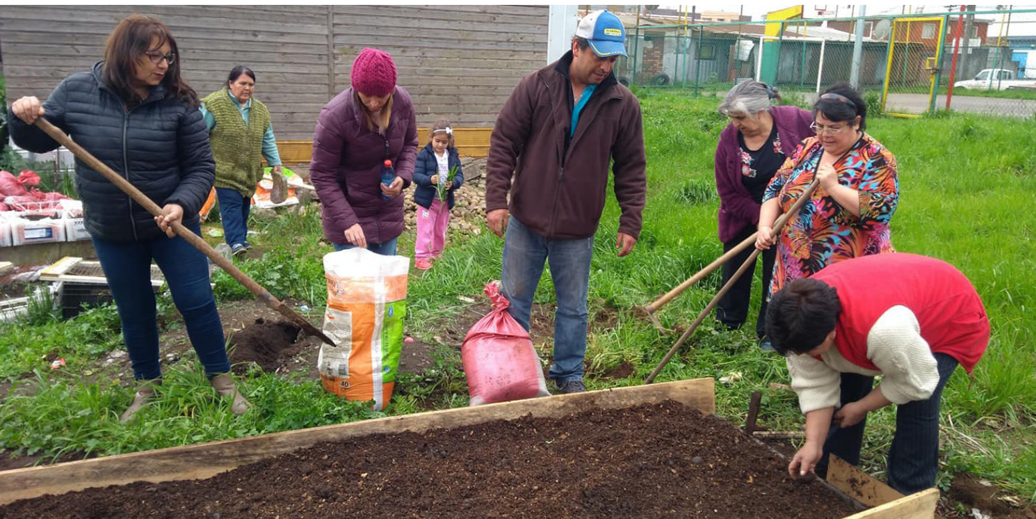
Figuras 3 y 4. Huertos en la ciudad de Temuco.

Las los huertos urbanos en Temuco se caracterizan principalmente por ser construidos de manera comunitaria, en donde la construcción y gestión recae en los vecinos y vecinas que habitan en las inmediaciones del huerto. Las ubicaciones de los estos, en su gran mayoría, son espacios barriales en recuperación, eligiendo sitios eriazos, lugares de peligro o áreas verdes. Generalmente se encuentran ubicados en sectores periféricos tanto de la ciudad como en los mismos barrios, por lo que seguridad e iluminación son aspectos relevantes.