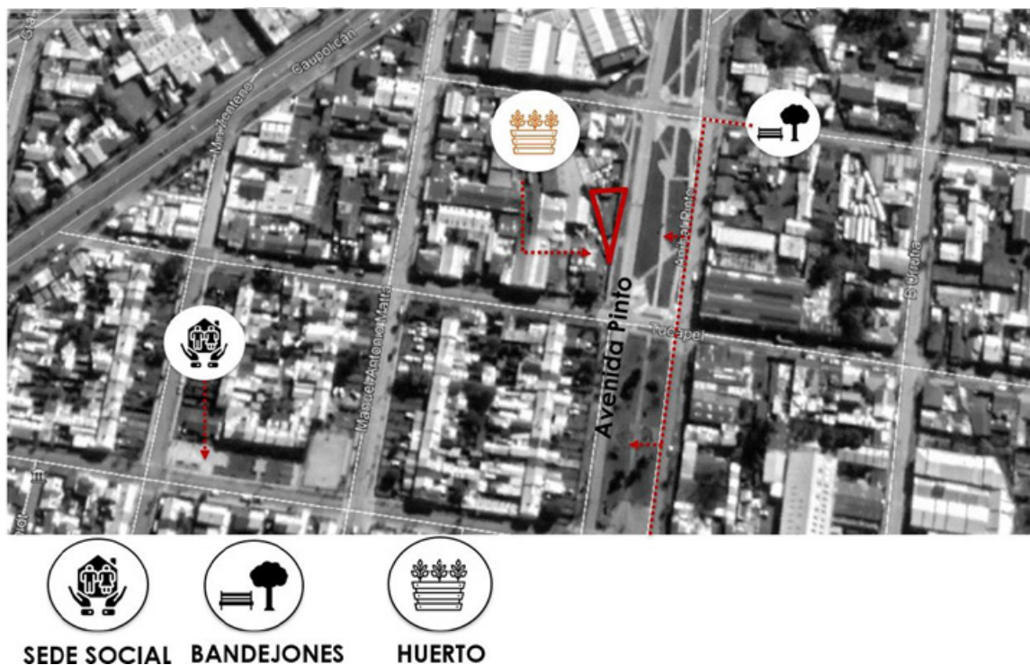
Figura 7. Ubicación del Huerto Urbano.

Finalmente, el emplazamiento del huerto quedó ubicado al norte de los límites del barrio, junto al bandejón central de la Av. Pinto, a cuatro cuadras de la sede social del barrio, una distancia prudente, que se logra recorrer en un máximo de 15 minutos a pie, teniendo en cuenta las condiciones de movilidad de las y los vecinos.