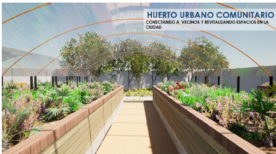
Figura 5. Primera propuesta entregada al barrio por parte del municipio, en la que se aprecian bancales elevados y árboles frutales. Acta sesión del concejo municipal de Temuco, junio 2023.

A la propuesta del municipio (presentada por medio de Acta sesión del concejo municipal de Temuco en junio del 2023), se le realizaron una serie de observaciones por parte de la Junta de Vecinos, tanto en el diseño, como en uso del espacio para el huerto. Relevando por parte de la Junta de vecinos, que este será un espacio utilizado por adultos mayores , por lo que debe tener características de accesibilidad universal pensadas en quienes realmente utilizarán este espacio. Con esta observación, toman importancia la realización del diseño de bancales elevados para favorecer la postura corporal de las personas, los accesos universales dentro del huerto, para que vecinas y vecinos con movilidad reducida puedan hacer uso efectivo del espacio, entre otras medidas. Igualmente, es relevante la seguridad y la sensación de la misma en el huerto y su entorno, por lo que el proyecto considera un sistema de cámaras de vigilancia .