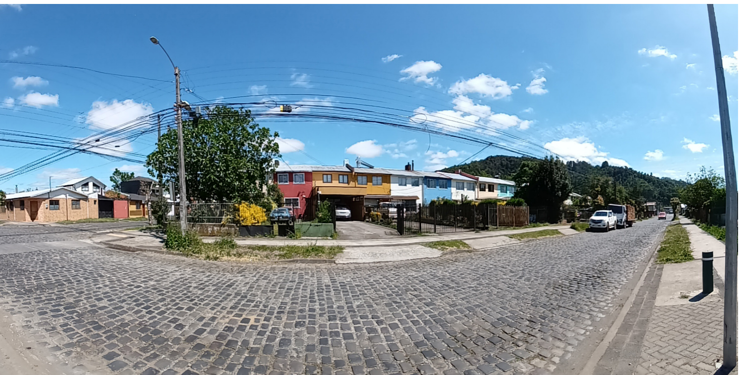
Figura 2. Conjunto arquitectónico casas Barrio Tucapel.

Entre los barrios más antiguos desarrollados en la ciudad, el Barrio Tucapel, ubicado en el sector centro de Temuco, se caracteriza por su historia ligada principalmente al uso residencial, construida como una población obrera en 1927 por la caja de la Habitación Popular. Este sector, destaca por ser reconocido por sus antiguas y fuertes organizaciones sociales, Junta de vecinos población N°20 Tucapel Temuco, y el Club de adulto mayor, las que cuentan con una alta participación de los vecinos lo que fue relevado por el MINVU el año 2015, al declararlo Barrio de Interés Regional (MOLINA, 2020).