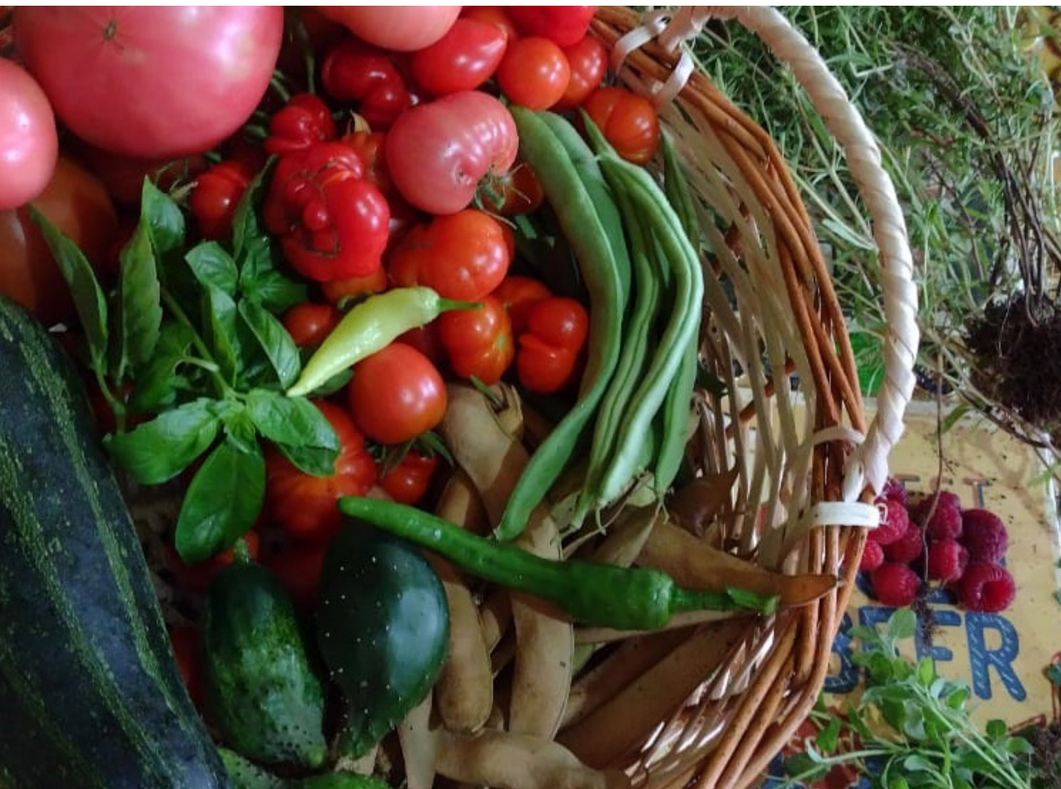
Figura 9. Cosecha del Barrio Tucapel.

Toma relevancia aquí el concepto de “Küme Mongen” o “buen vivir”, que según la cosmovisión de la cultura Mapuche hace énfasis en la armonía y equilibrio existente entre la naturaleza, seres humanos y su mundo espiritual. Hace reflexionar en torno a la felicidad, la sostenibilidad y la justicia social (MEZA-CALFUNANO, et al. 2018).