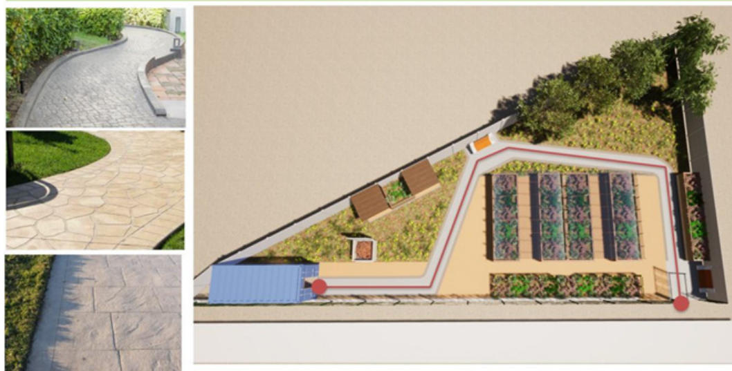
Figura 6. Propuesta de circulación del huerto urbano del Barrio Tucapel. Acta sesión del Concejo Municipal de Temuco, junio 2023.