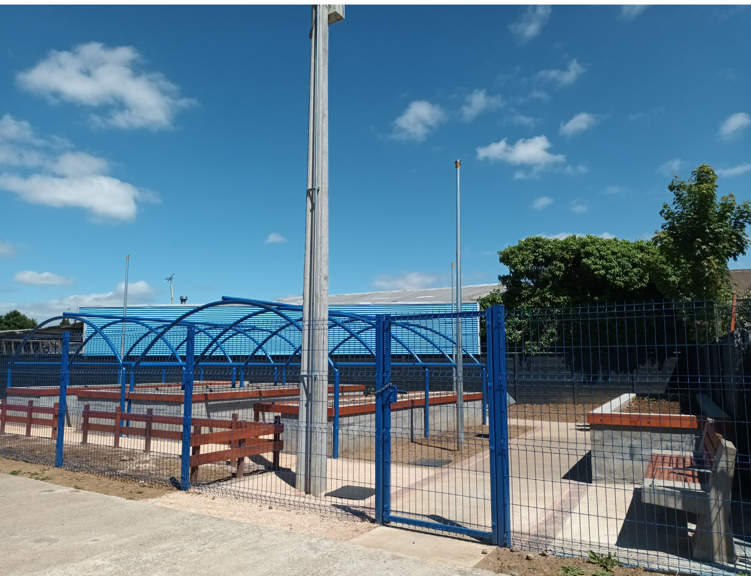
Figura 8. Fotografía del huerto construido.